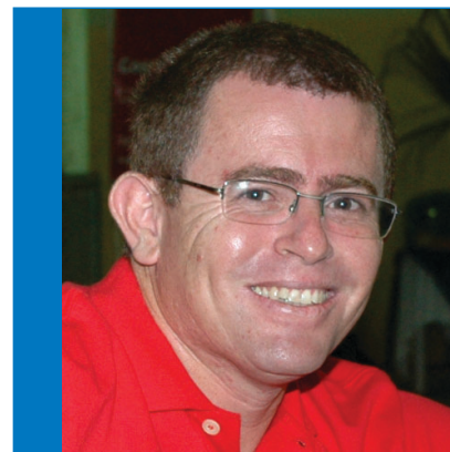
Cons. de Representantes (suplente)

Estar filiado ao Sindserv é importante para fortalecer a luta sindical e conquistar benefícios à categoria, defender seus direitos e combater abusos cometidos contra os servidores. Além destes aspectos, os servidores sindicalizados passam a contar com várias assistências oferecidas pelo sindicato, como plano de saúde - médicos e dentista - convênio com Tebar Praia Clube, Costa Marina Seguros, cursos de xadrez, corte e costura, cabeleireiro, direito a voto nas assembleias e participar de festas e demais encontros. Vá ao Sindserv e conheça melhor a lista de benefícios.